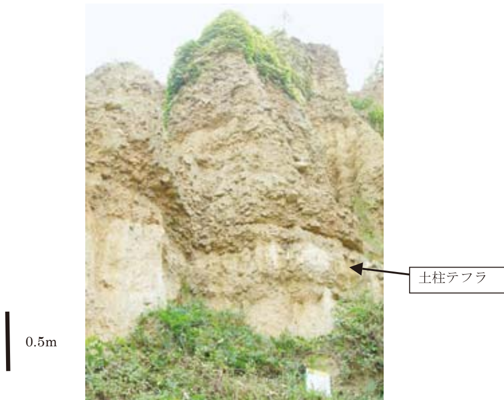
図4 土柱テフラの産状。 テフラは中央下の白色の層準