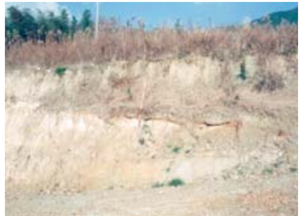
図2 城テフラの産状。テフラはポールの基部付近の白色の層準

受けていない。この礫層は、阿讃山脈を南流する河川が運搬・堆積した旧扇状地性堆積物と考えられる。現在この露頭は、徳島自動車道の開通により観察できない。