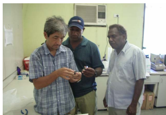
図2. A. 学習支援室(総合科学部スタジオ:写真左)および B. ソロモン諸島国(写真右)におけるおもしろ講座「ものづくり」の授業風景

また、例示した作品では、プラスチック素材への穴あけやリード線の切断・加工が必要になっている。卵保護装置の製作においては、例示作品の模倣品は皆無であったが、LEDライトボックスの製作では、自由製作をするためには根気と時間が必要となるため、例示作品の類似作がほとんどであった。ソロモン諸島では、もっとも必要な生物顕微鏡の光源として使用するために、8例すべてが例示作品と全く同じ部位にLEDが配置された作品であったが、徳島大学では4例すべてLEDの配置は異なっていた。このように目的意識の違いにより、可能な範囲で独創性を発揮しようとする意欲が異なることが示された。今回のおもしろ