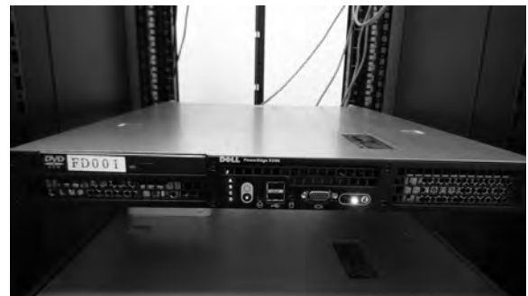
図1 ハードウェア外観