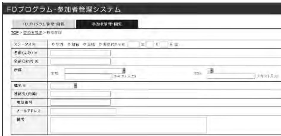
図 9 個人データ入力画面