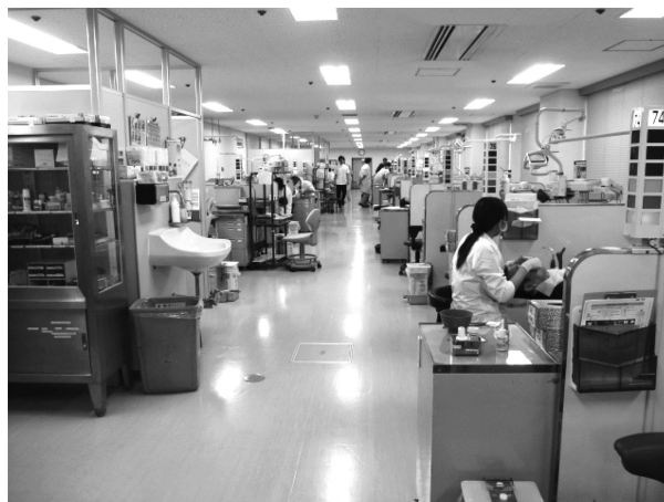
図1 学生診療室での診療風景

学生は一日1人もしくは2人の患者を診察している。基本的に各チェアには午前・午後一人ずつの患者予約が入っており、30台のチェア予約にはほとんど空きがなかった。一人の患者の診療に費やす時間はおよそ