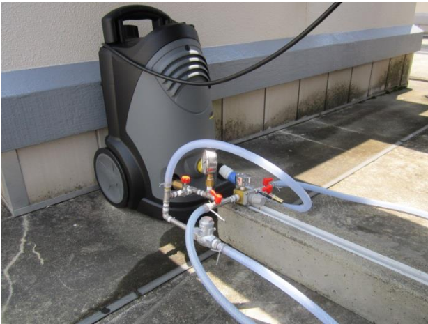
図4 高圧洗浄機と配管類の設置状況

高圧洗浄ポンプの設置状況を図4に示す。高圧洗浄機の高圧ホースを接続する部分は一般的な配管用のネジとは異なっていたため、工作センターにて一方がM22×1.5mm（メス）、反対側がRc \frac{1}{4} となるような変換用のアダプターを作製した。その他の部材についてはR \frac{1}{4} を基本として適宜ブッシング等を用い組み立てた。