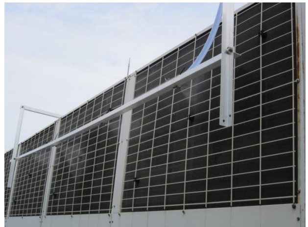
図3 散水ノズルの設置状況

散水ノズルはアルミのL型アングル材に固定し、そのアングル材をエアコン室外機に固定した。散水ノズルは当初図3に示すように、室外機の凝縮器面から200mm離して設置していたが、特に散水量の少ないノズル（表1の#1）を使用すると、風により流されて凝縮器に達する水量が減少することが分かったため、凝縮器面から100mmに変更した。また、図3に写