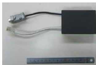
図7 無線化後の使用機器

実験では，2台のノートパソコンにて無線接続を確認したが，全く問題なく中継装置との通信に加え，中継装置と各カードリーダー間の通信状況を有線接続と同様に確認できた。