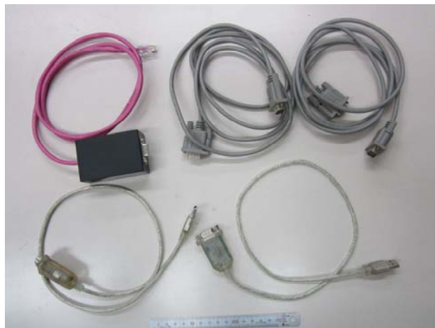
図6 無線化前の使用機器

図6，図7の下部に15cmの鋼尺を大きさの比較用に置いている。図7の箱内にRS485-RS232変換ICと電源IC，さらに2系統のBluetoothアダプタを組み込んだ。箱の大きさは80×60×40mmである。