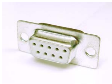
図1 一般的なRS232コネクタ（9ピン）

そこで今回、Bluetoothアダプタを用いてRS232の無線（ケーブルレス）化を実施したので報告する。