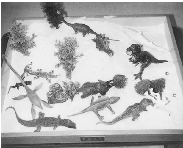
写真2：8回目（11月下旬）：恐竜（7匹）、ワニ（4尾）、鯨（1頭）、動物の屍骸（1匹）、木（7本）、木の切り株（1本）、ビー玉（8個）、池、海。池の中でのワニどうしの闘い、恐竜はビー玉を食わえている。