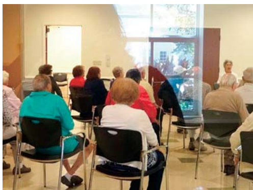
写真5 集団のチェア体操