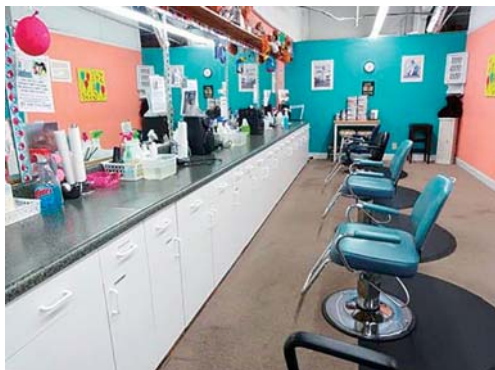
写真8 Lice solutions の処置室