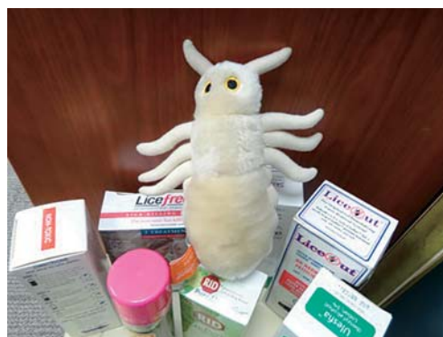
写真7 アタマジラミのぬいぐるみと薬

した高齢者ケアに関する研究活動を行っている。そのため、本施設を利用する利用者・家族に対して、研究の同意を得ているという。