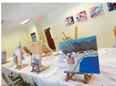
写真6 認知症高齢者が描いた絵画