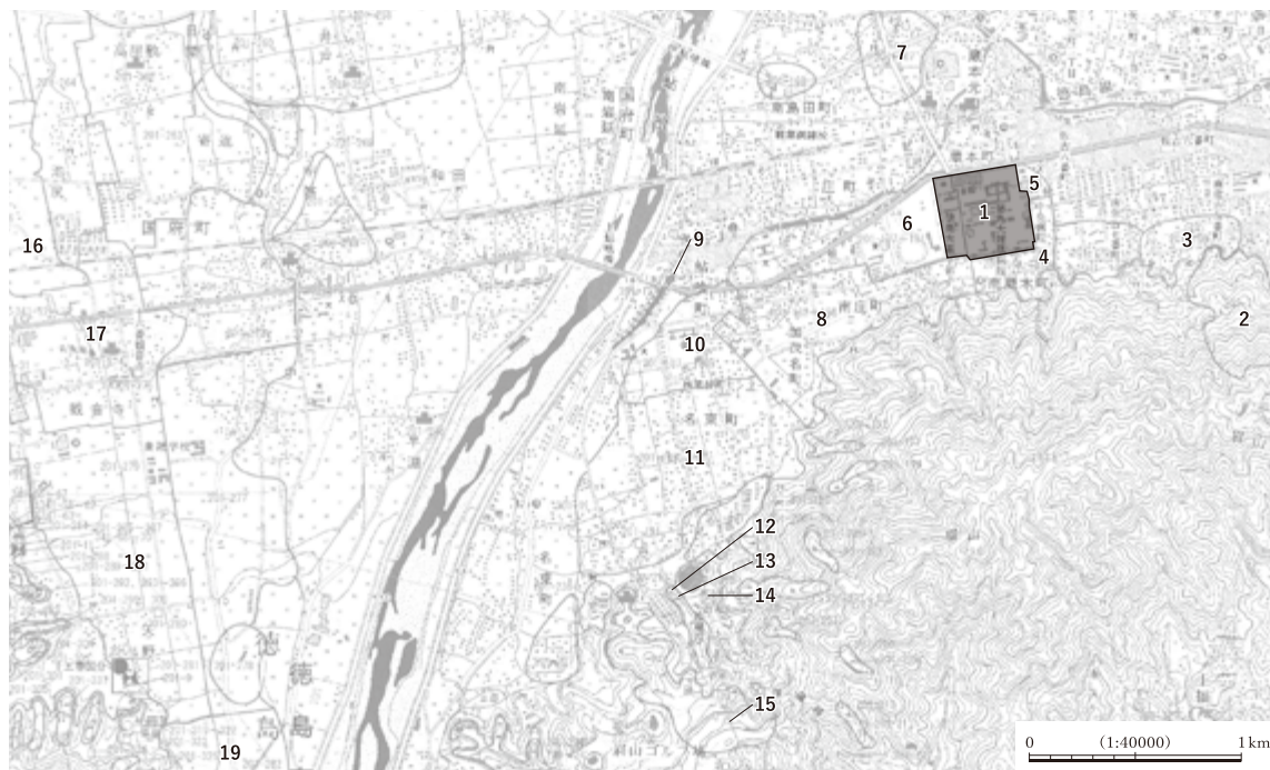
図 1-1 庄・蔵本遺跡と周辺遺跡の位置

1. 庄・蔵本遺跡 2. 蜂須賀家万年山墓所 3. 三谷遺跡 4. 南蔵本遺跡 5. 蔵本遺跡 6. 庄遺跡 7. 中島田遺跡 8. 南庄遺跡 9. 袋井用水の水源地 10. 鮎喰遺跡 11. 名東遺跡 12. 節句山1号墳 13. 節句山2号墳 14. 穴不動古墳 15. 八人塚古墳 16. 敷地遺跡 17. 観音寺遺跡 18. 矢野遺跡 19. 延命遺跡（徳島県教委・徳島県埋文編 2006 をもとに作成）